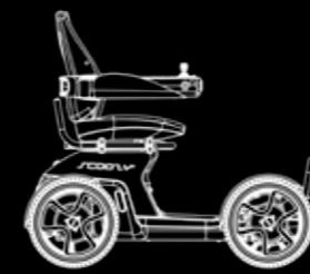
Lengte 1350 mm