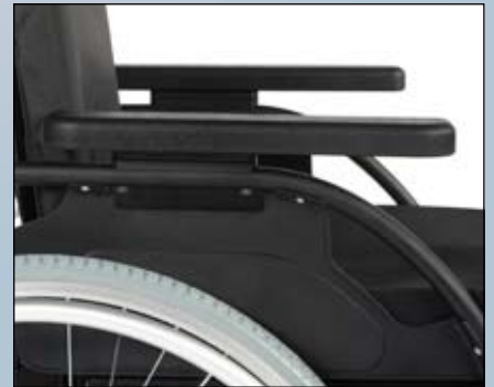
Afneembaar en wegklapbare armsteunen met in hoogte instelbare armleggers (lang en kort).