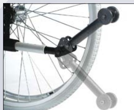
Naar boven wegzwenkbare anti-tip voorziening.