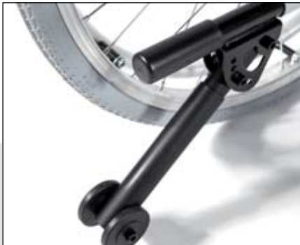
Anti-tip voorziening met geïntegreerde trapbuis.