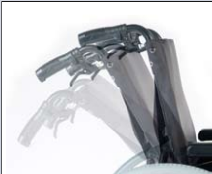
30° inclineerbare rugleuning.