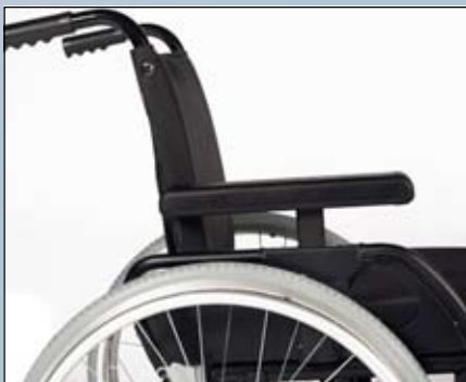
Afneembaar en wegklapbare armsteunen met in hoogte verstelbare armleggers (lang en kort).