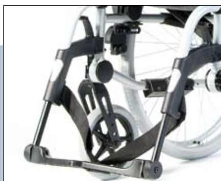
Naar binnen en buiten wegzwenkbare 70° beensteunen.