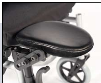
In hoek en diepte instelbare amputatie-steun.