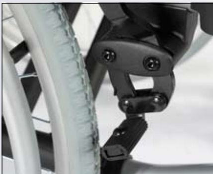
Kniehevelrem (open mechanisme).