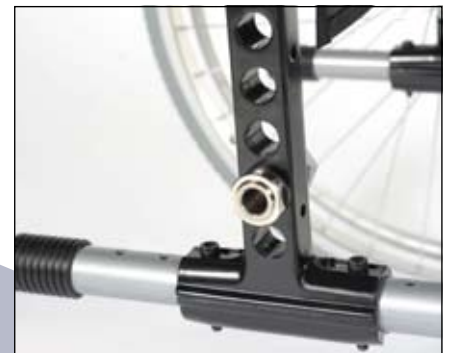
Asplaatinstelling voor zithoogte en zwaartepuntinstelling.