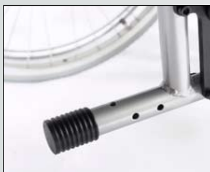
In het frame geïntegreerde standaard trapbuis voorziening.