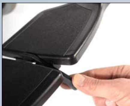
In hoek instelbare kunststof voetplaten met vergrendeling.