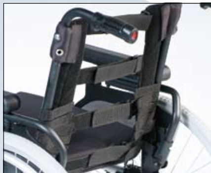
Eenvoudig naspanbare rugbekleding (4-straps).