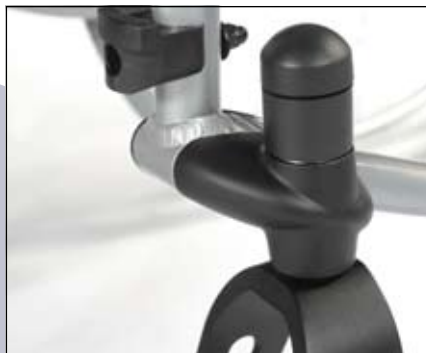
Instelbaar balhoofdsysteem voor zithoogte en zithoekinstelling (0°, 3° & 6°).