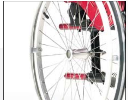
24" design achterwielen (radiaal gespaakt).