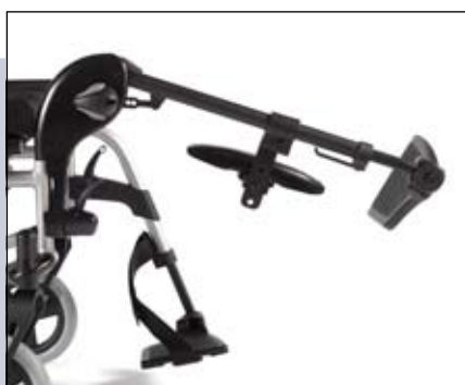
Lengte compenserende comfort beensteunen met holle kuitplaat.