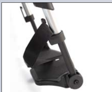
In hoek instelbare kunststof voetplaten met hielband.