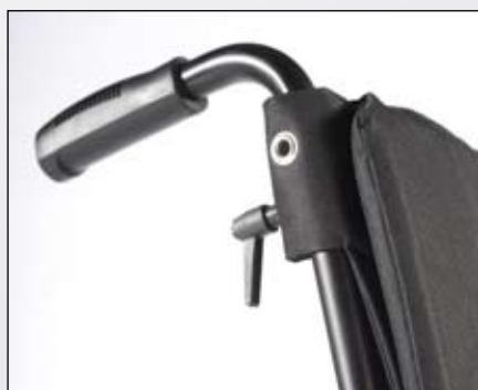
In hoogte verstelbare duwhandvatten geïntegreerd in de rugbuizen.

De X-Family heeft standaard een uitgebreid assortiment aan opties, instel- en verstelmogelijkheden.