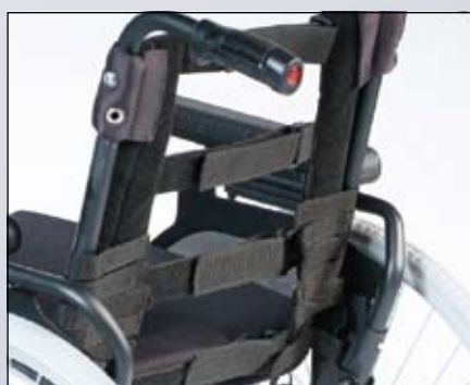
Naspanbare rugbekleding (4-straps klittenband).