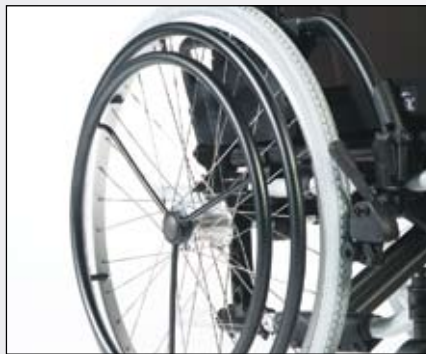
One Arm Drive (links of rechts gemonteerd).