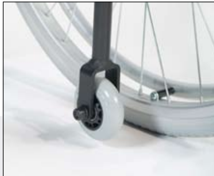
3" transportwielen geïntegreerd in het frame.