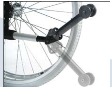
Naar boven wegzwenkbare anti-tip voorziening.