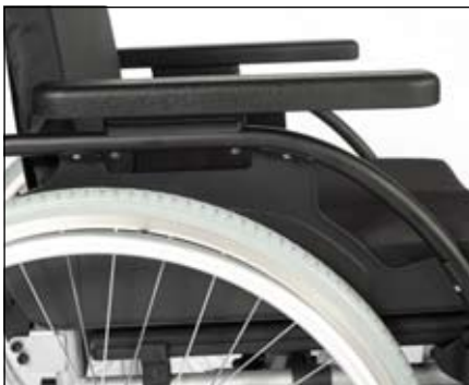
Korte en lange comfortabele armsteun in één.