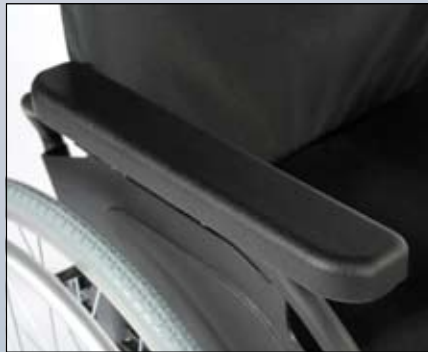
Comfortabele armsteun met afgeronde hoeken.