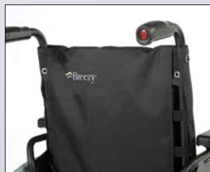
Eenvoudige 3-straps nylon rugbekleding.