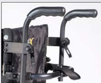
In hoogte verstelbare duwhandvatten gemonteerd op de rugbuizen.