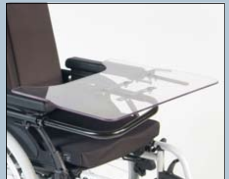
Links of rechts wegklapbaar werkblad.