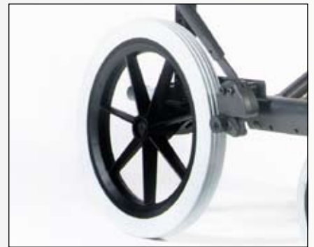
12" achterwielen met kunststof velgen en massieve banden.