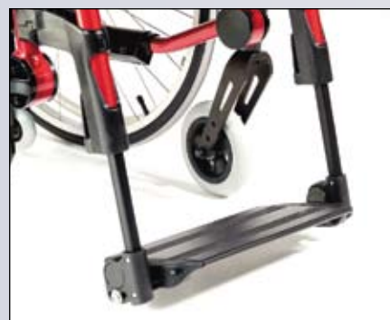
Eenvoudig opklapbaar en in hoek instelbare aluminium voetplaat.