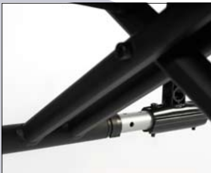
Stevig drie-armig kruisframe.